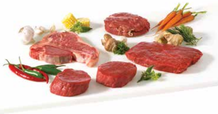
松谷农场优质牛肉 我们的牛肉蕴含大自然的馈赠

“松谷农场优质牛肉，品质优良超乎想象 您的一再选购是对我们坚守品质诺言的， 最大肯定。”